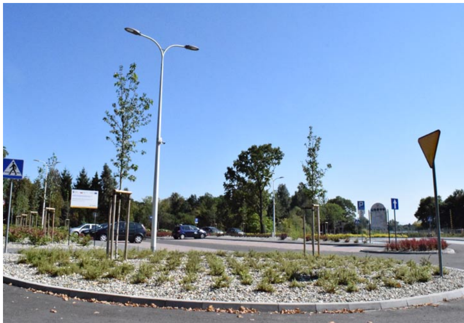
ZDJĘCIE NR 25 | CENTRUM PRZESIADKOWE PRZY UL. PARKOWEJ