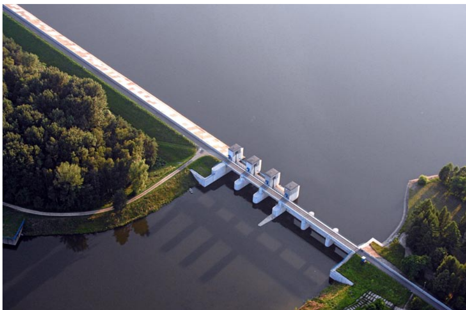
ZDJĘCIE NR 4 | KORONA ZAPORY