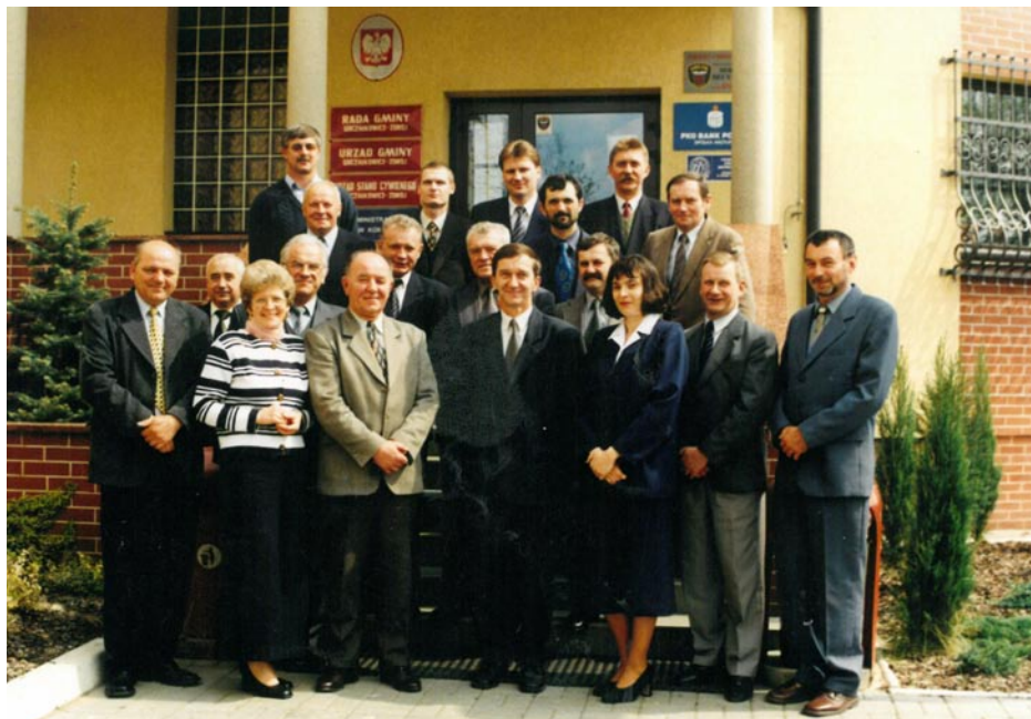
ZDJĘCIE NR 9 | RADA GMINY III KADENCJI 1998-2002

poczęto budowę siedziby gimnazjum, a w listopadzie 2002 r. - hali sportowej. Z budżetu gminy sfinansowano także remont dachu kościoła. Ponadto w obrębie DK1 zamontowano sygnalizację świetlną, która ułatwiła komunikację i zapewniła bezpieczeństwo na terenie miejscowości (zdz. nr 10).