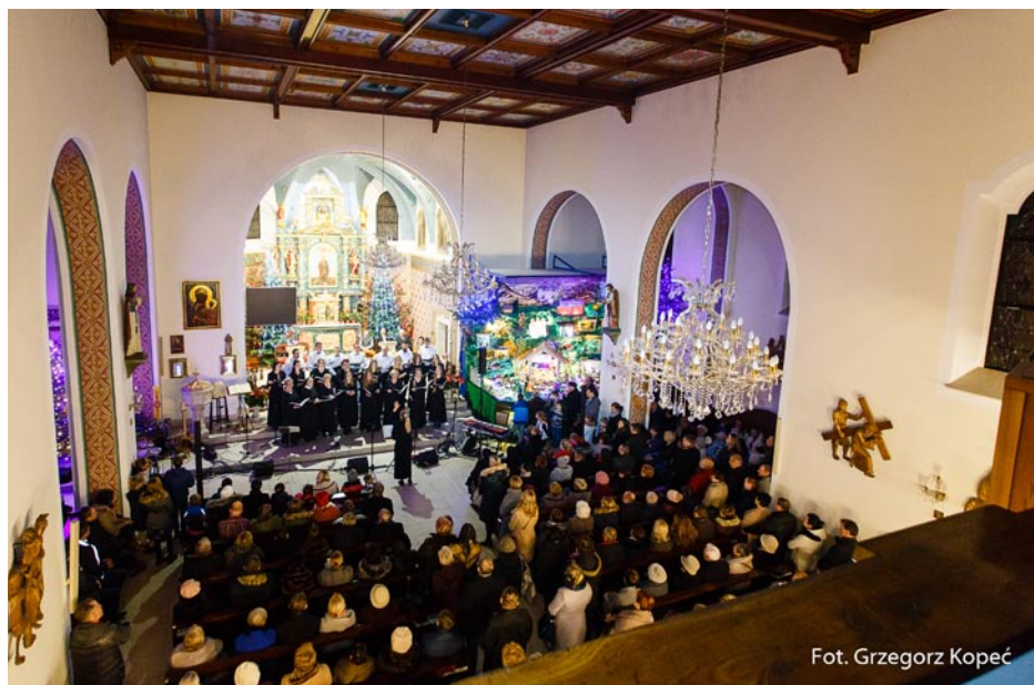
ZDJĘCIE NR 51 | KONCERT ŚWIĄTECZNY CHÓRU PARAFIALNEGO SEMPER COMMUNIO W KOŚCIELE PARAFIALNYM