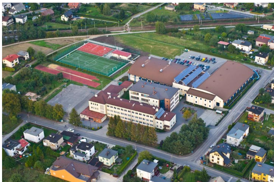
ZDJĘCIE NR 61 | BOISKO ORLIK PO ODDANIU DO UŻYTKU