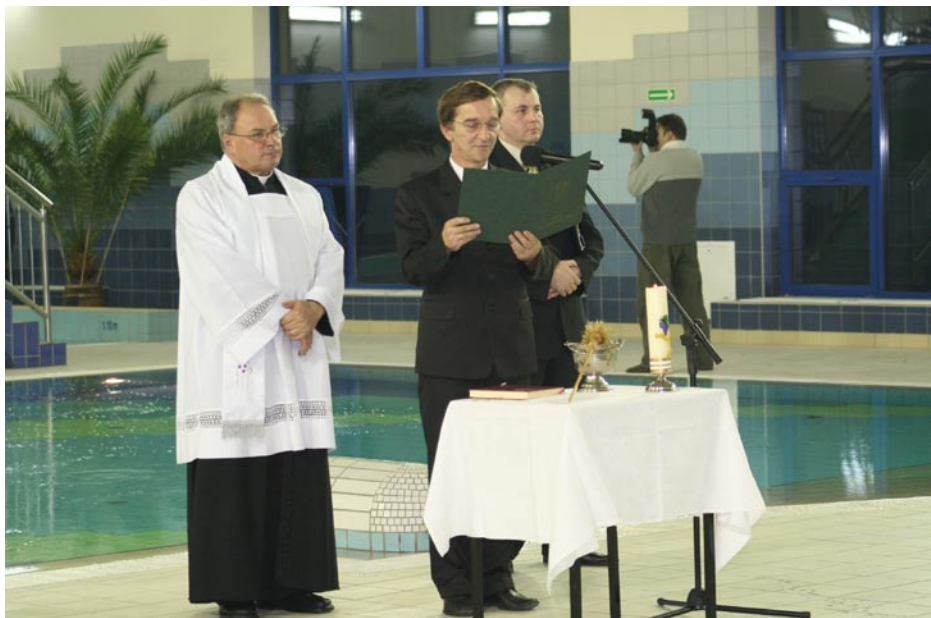
ZDJĘCIE NR 11 | OTWARCIE KRYTEJ PŁYWAŁNI 24.11.2006 ROKU