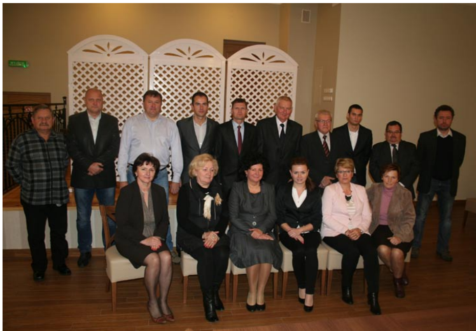
ZDJĘCIE NR 19 | RADA GMINY VII KADENCJI 2014-2018