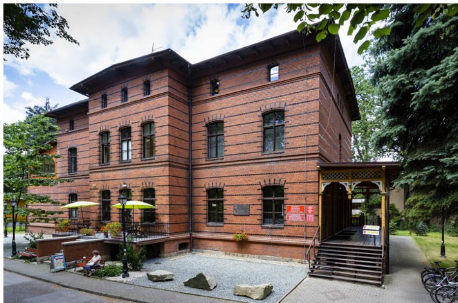
ZDJĘCIE NR 47 | SIEDZIBA GMINNEGO OŚRODKA KULTURY, GMINNEJ BIBLIOTEKI PUBLICZNEJ ORAZ OŚRODKA POMOCY SPOŁECZNEJ W GOCZAŁKOWICACH- ZDROJU