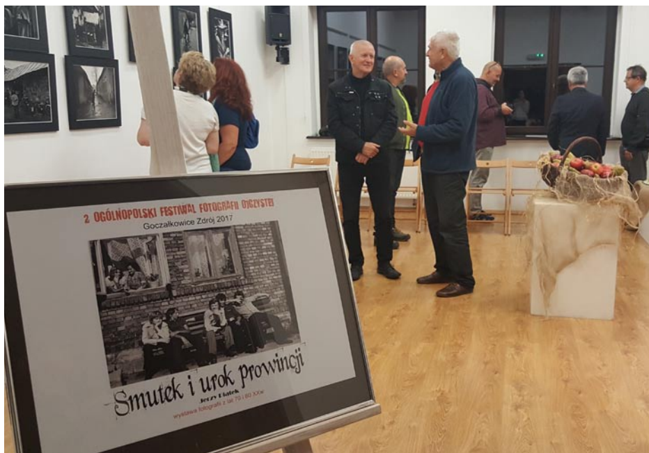
ZDJEŃCIE NR 55 | II OGÓLNOPOLSKI FESTIWAL FOTOGRAFII OJCZYSTEJ W GOCZAŁKOWICACH