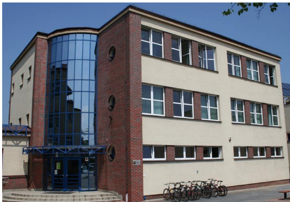
ZDJĘCIE NR 43 | SIEDZIBA GIMNAZJUM DO 2017 ROKU