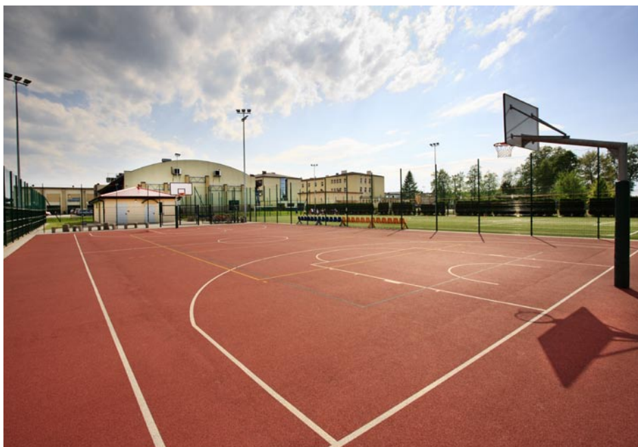
ZDJĘCIE NR 16 | BOISKO ORLIK W 2012 ROKU