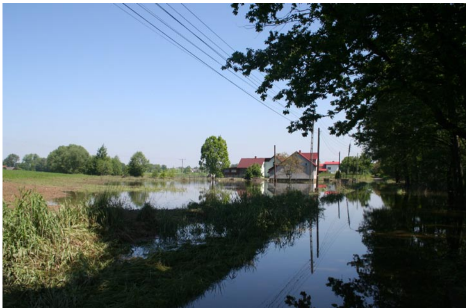
ZDJĘCIE NR 13 | POWÓDŹ W 2010 ROKU - WIDOK NA UL. DĘBOWĄ