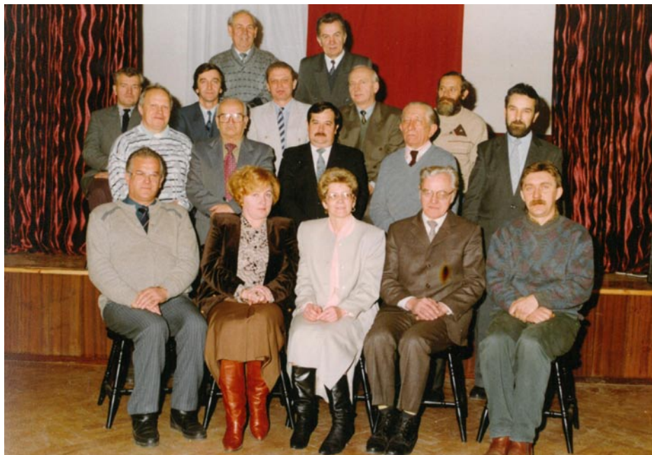
ZDJĘCIE NR 7 | RADA GMINY II KADENCJI 1994-1998