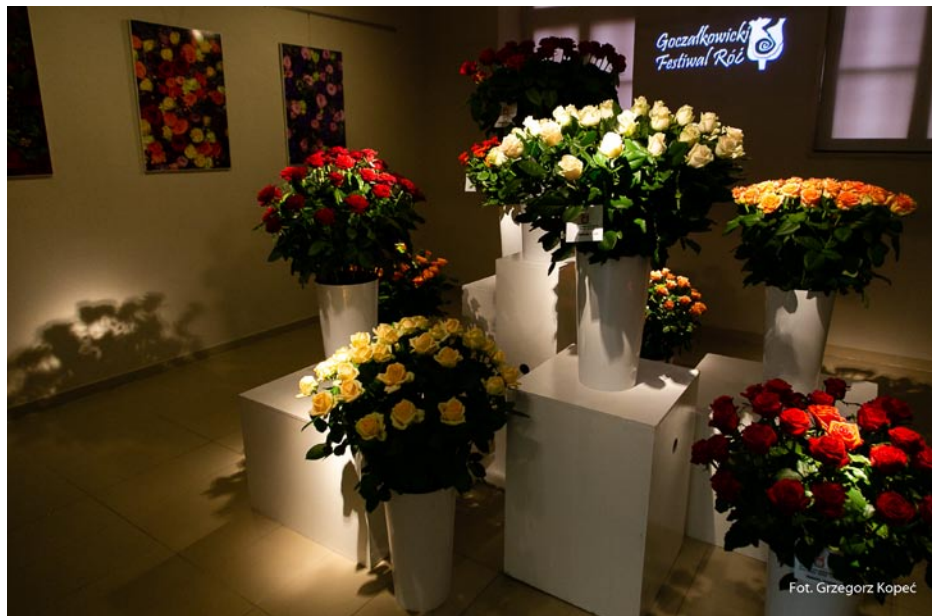
ZDJĘCIE NR 50 | WYSTAWA KWIATÓW NA FESTIWALU RÓŻ