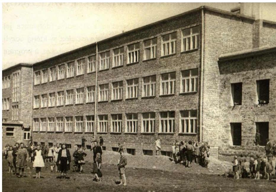
ZDJĘCIE NR 38 | BUDYNEK NOWEJ SZKOŁY PODSTAWOWEJ NA ZDJĘCIU Z 1953 R.