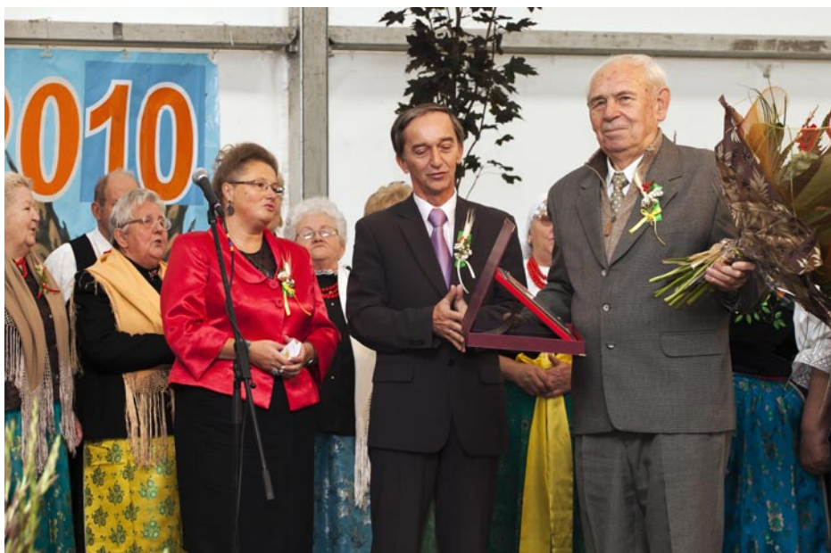
ZDJĘCIE NR 33 | ZBIGNIEW MOLA OTRZYMUJE TYTUŁ HONOROWEGO OBYWATELA