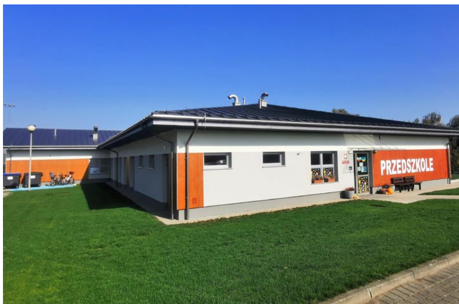
ZDJĘCIE NR 26 | NOWY BUDYNEK PUBLICZNEGO PRZEDSZKOLA NR 2