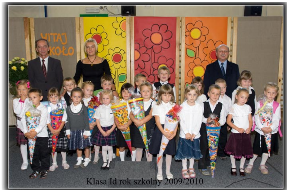
ZDJĘCIE NR 44 | PIERWSI 6-LATKOWIE W MURACH SP 1