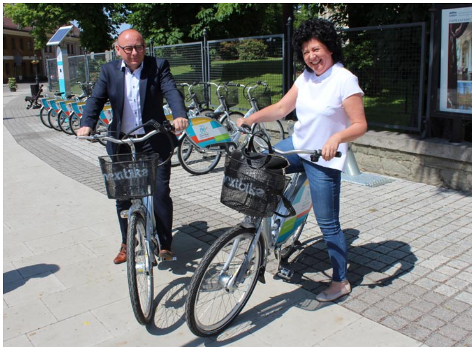
ZDJĘCIE NR 64 | WÓJT GMINY GOCZAŁKOWIC-ZDROJU I BURMISTRZ PSZCZYNY PODCZAS INAUGURACJI WYPOŻYCZALNI ROWERÓW.