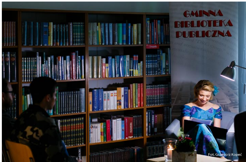
ZDJĘCIE NR 46 | SPOTKANIE AUTORSKIE W BIBLIOTECE