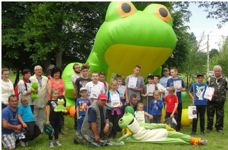
ZDJEŃCIE NR 54 | ZAWODY WĘDKARSKIE Z OKAZJI DNIA DZIECKA NA STAWIE RONTOK