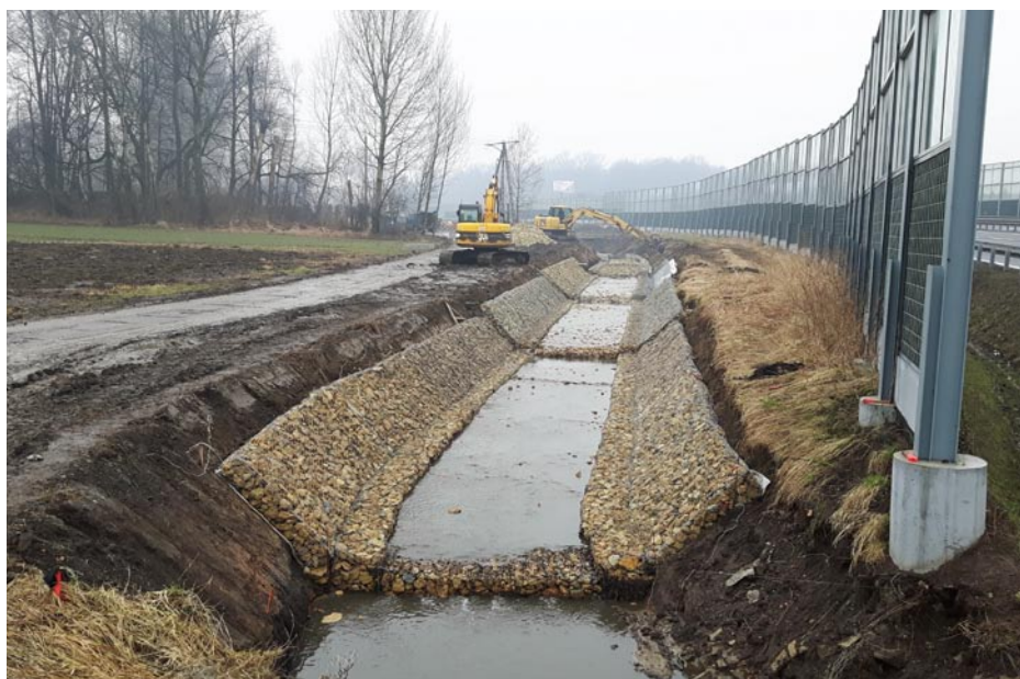
ZDJĘCIE NR 20 | PRZEBUDOWA POTOKU GOCZAŁKOWICKIEGO