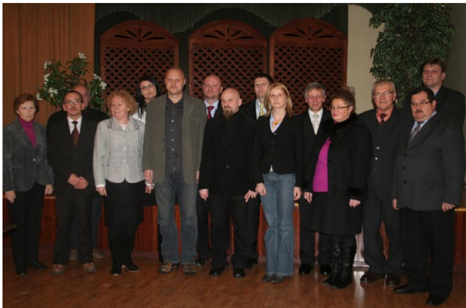
ZDJĘCIE NR 15 | RADA GMINY VI KADENCJI 2010-2014