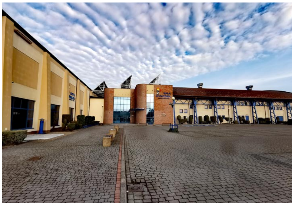
ZDJĘCIE NR 59 | KOMPLEKS SPORTOWY