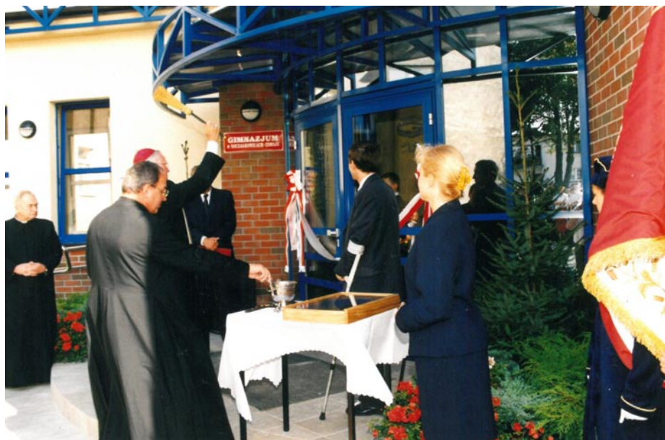
ZDJĘCIE NR 42 | UROCZYSTE OTWARCIE NOWEGO BUDYNKU GIMNAZJUM