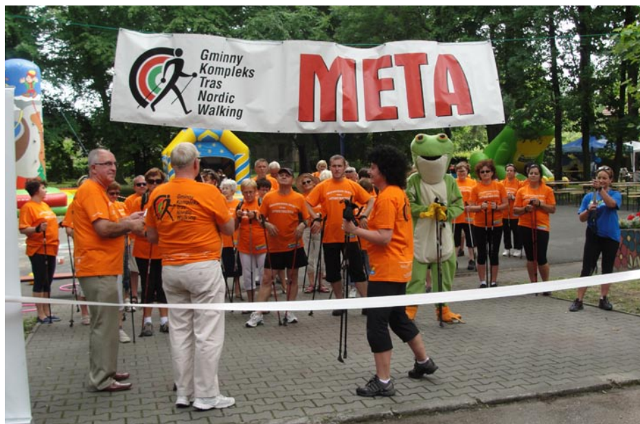
ZDJĘCIE NR 65 | UROCZYSTE OTWARCIE GMINNYCH TRAS NORDIC WALKING