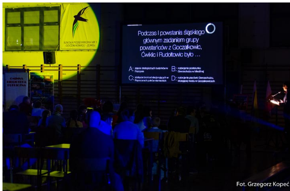
ZDJĘCIE NR 56 | QUIZ RODZINNY Z OKAZJI SETNEJ ROCZNICY ODZYSKANIA NIEPODLEGŁOŚCI