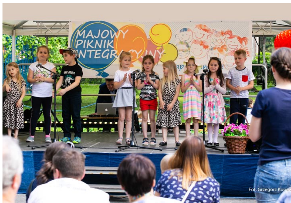
ZDJĘCIE NR 57 | PIKNIK W RAMACH REALIZACJI PROJEKTU „INTEGRACJA-TOLERANCJA”