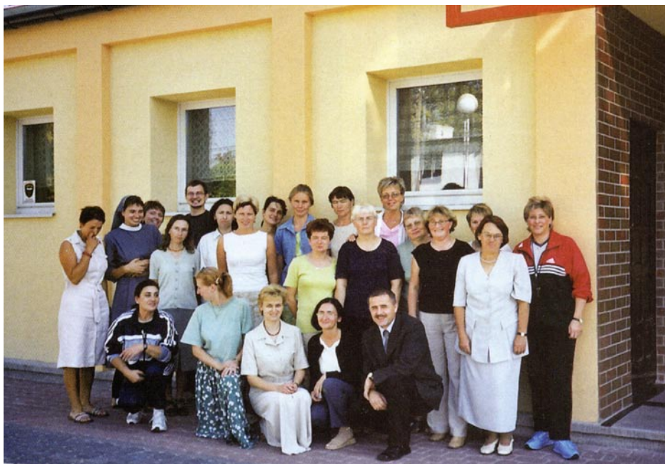
ZDJĘCIE NR 41 | GRONO PEDAGOGICZNE PRZED ODNOWIONĄ SZKOŁĄ 2003 R.