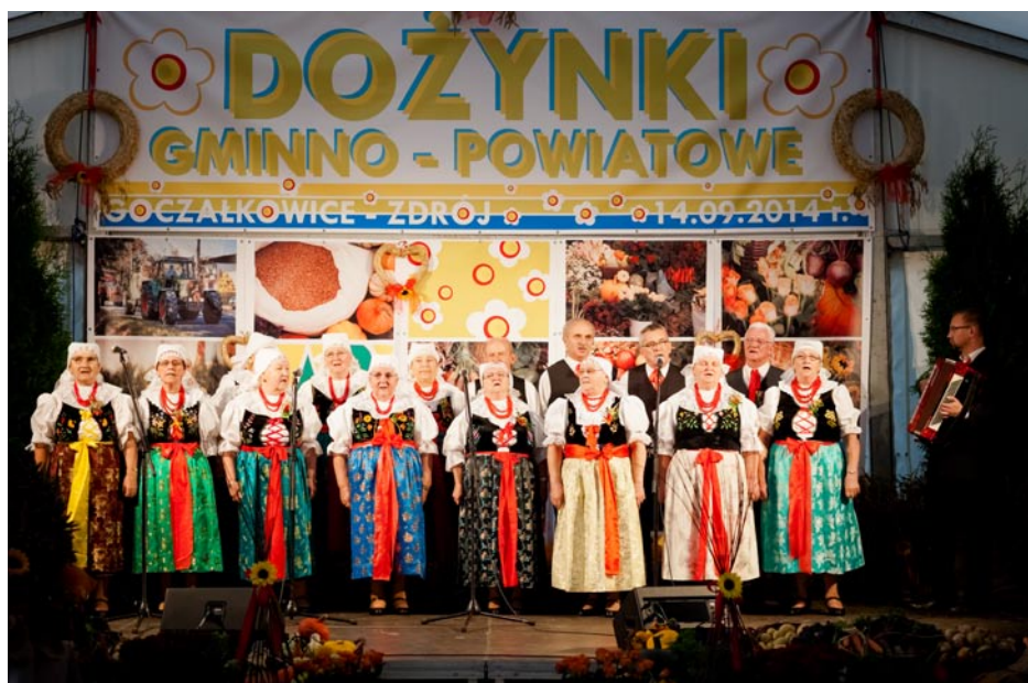
ZDJĘCIE NR 49 | ZESPÓŁ FOLKLORYSTYCZNY GOCZAŁKOWICE NA GMINNO-POWIATOWYCH DOŻYŃKACH W 2014 R.