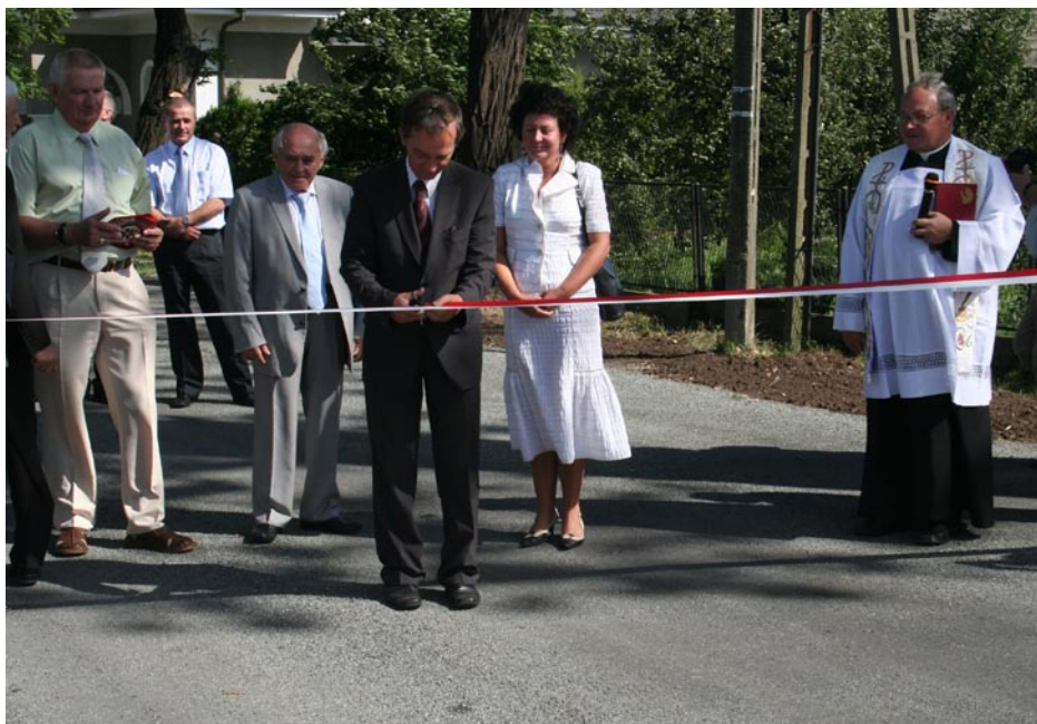
ZDJĘCIE NR 12 | OTWARCIE RONDA POD BOCIANEM – 2009 ROK