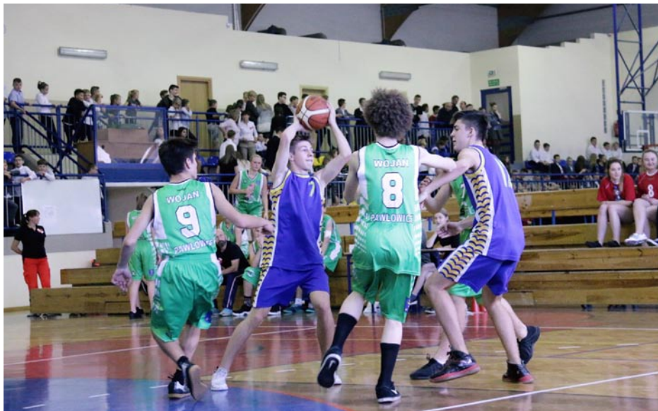
ZDJĘCIE NR 62 | ROZGRYWKI SPORTOWE NA HALI