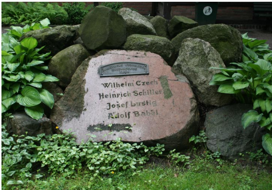
ZDJĘCIE NR 1 | TABLICA UPAMIĘTNIAJĄCA ZAŁOŻYCIELI UZDROWISKA