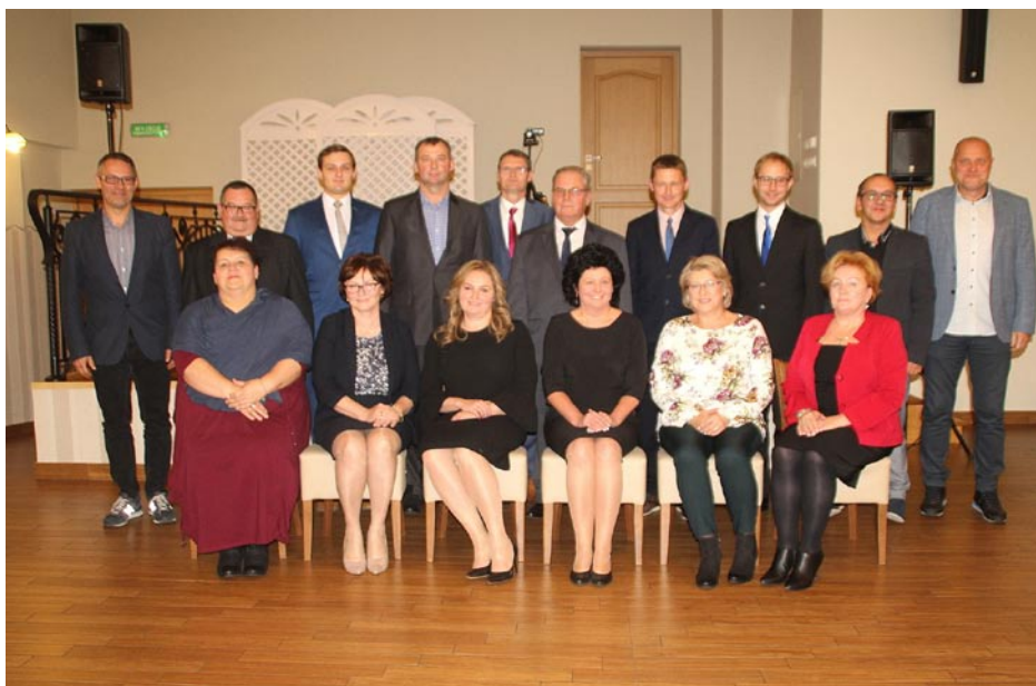
ZDJĘCIE NR 24 | RADA GMINY VIII KADENCJI 2018-2023