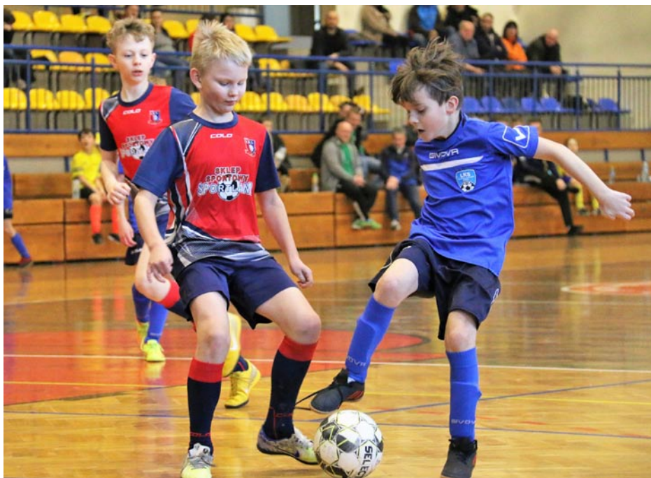
ZDJĘCIE NR 63 | ROZGRYWKI SPORTOWE NA HALI