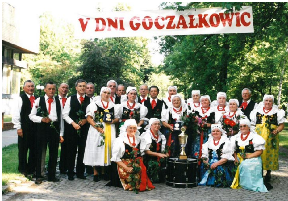
ZDJĘCIE NR 52 | ZESPÓŁ FOLKLORYSTYCZNY NA V DNIACH GOCZAŁKOWIC 2002 R.