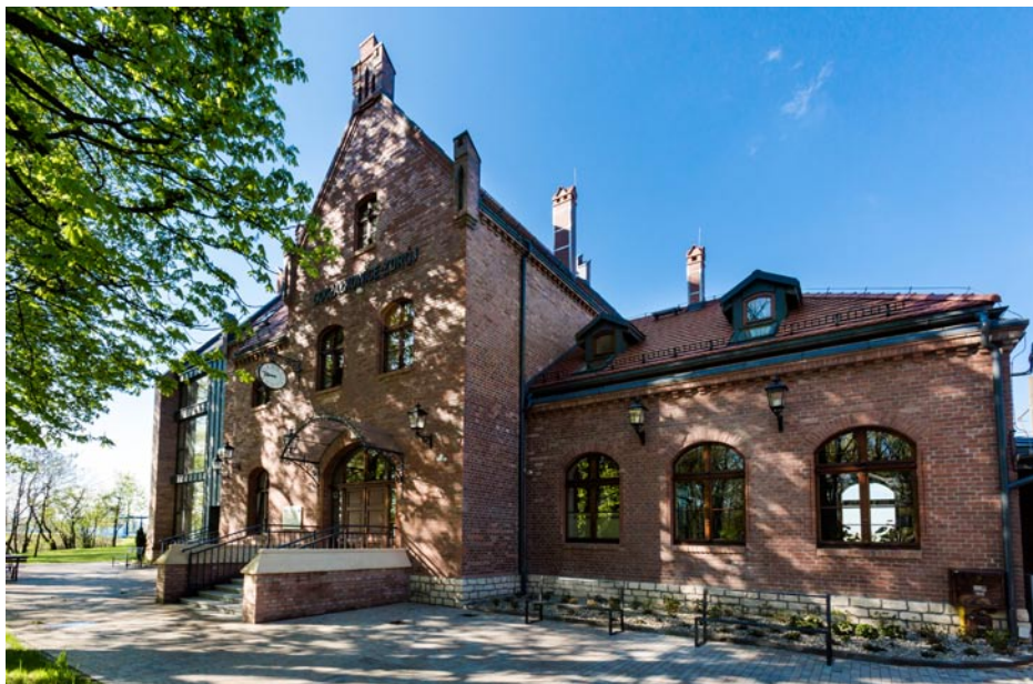
ZDJĘCIE NR 21 | BUDYNEK STAREGO DWORCA PO REWITALIZACJI