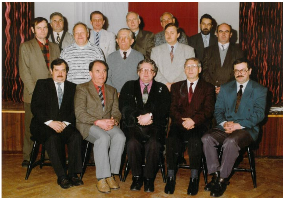
ZDJĘCIE NR 5 | RADA GMINY I KADENCJI 1992-1994