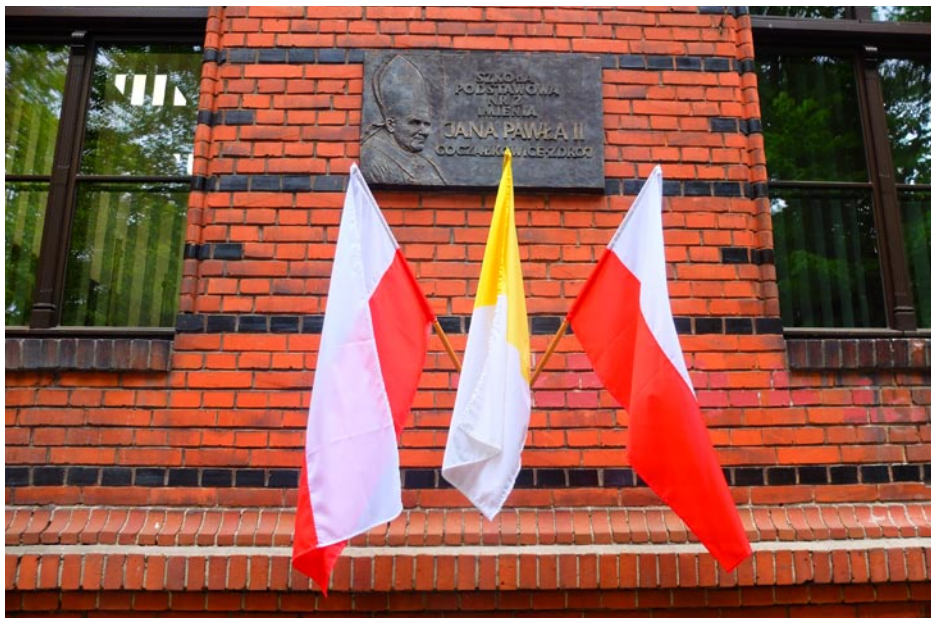
ZDJĘCIE NR 39 | TABLICA UPAMIĘTNIAJĄCĄ SZKOŁĘ PODSTAWOWĄ NR 2

Pojawiły się pierwsze osiągnięcia naukowe i sportowe na poziomie powiatu i województwa. Miały miejsce imprezy organizowane dla środowiska, takie jak: spektakle koła teatralnego, giełda szkół ponadgimnazjalnych, konkurs ortograficzny o tytuł Mistrza Ortografii Ziemi Pszczyńskiej, rozpoczęła się współpraca z Uniwersytetem Śląskim i Kolegium Nauczycielskim. Dzięki ogromnemu zaangażowaniu wielu ludzi z różnych środowisk udało się stworzyć szkołę ambitną, przyjazną uczniom i rodzicom, bezpieczną, umożliwiającą rozwijanie zdolności i zainteresowań, współpracującą ze środowiskiem lokalnym. Gimnazjum otrzymało miano przyjaznego praktykantom. Co roku w jego murach tajniki profesji nauczycielskiej zgłębiali na praktykach studenci różnych uczelni. Wiedza i doświadczenie nauczycieli przełożyły się na wysokie wyniki egzaminów gimnazjalnych (zdj. nr 43).