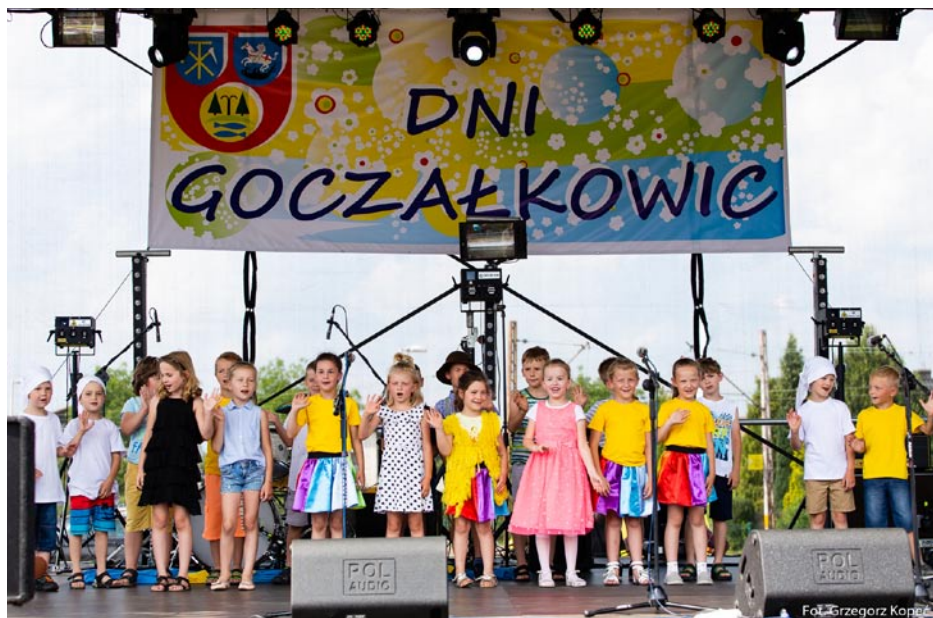
ZDJĘCIE NR 48 | WYSTĘP DZIECI NA DNIACH GOCZAŁKOWIC W 2018 ROKU