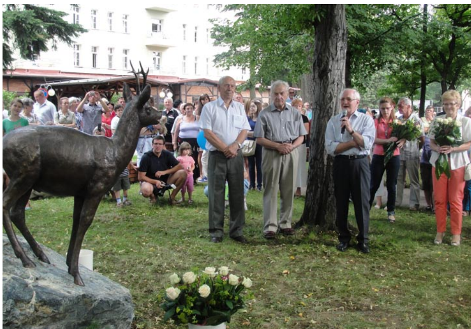
ZDJĘCIE NR 18 | ODSŁONIĘCIE RZEZBY KOZIOŁKA W PARKU ZDROJOWYM