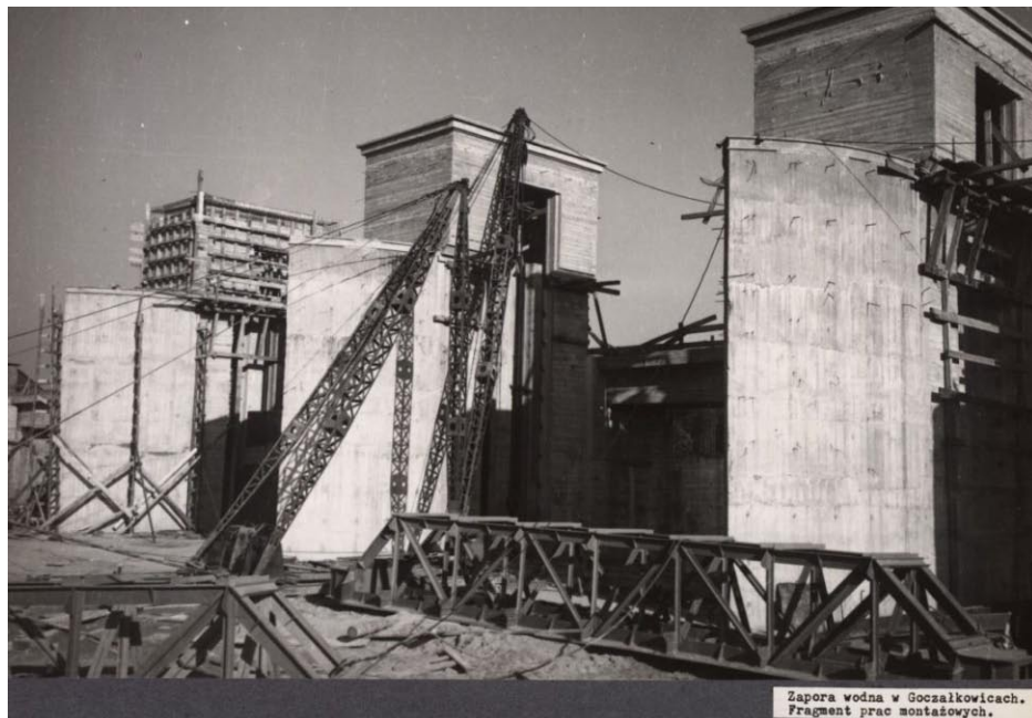
Zapora wodna w Goczałkowicach. Fragm. prac montażowych.