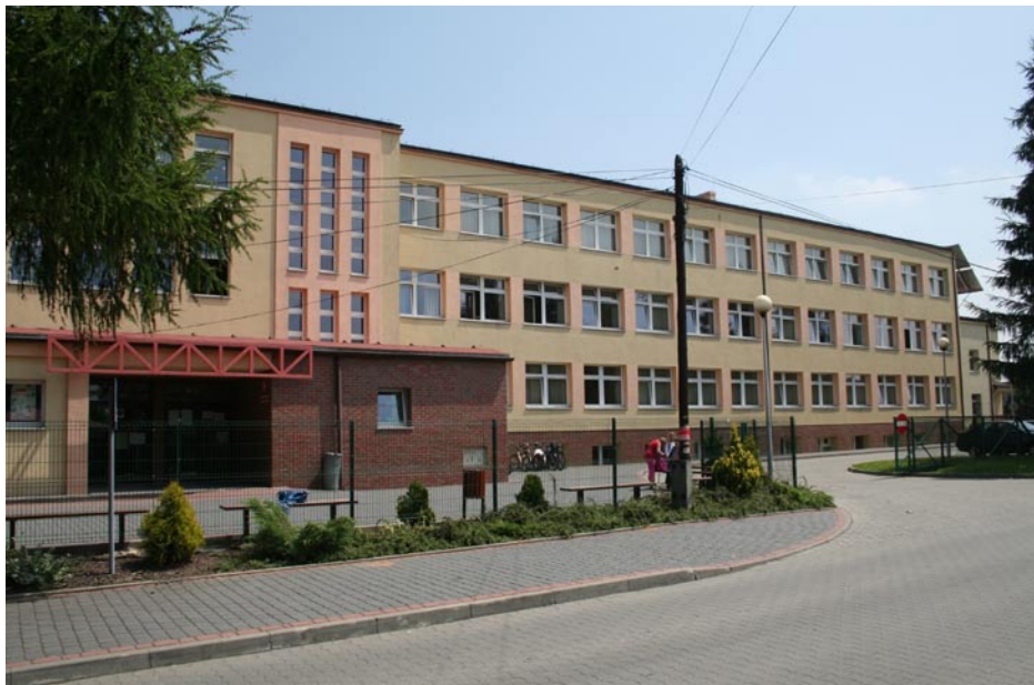
ZDJĘCIE NR 40 | SZKOŁA PODSTAWOWA NR 1 OBECNIE