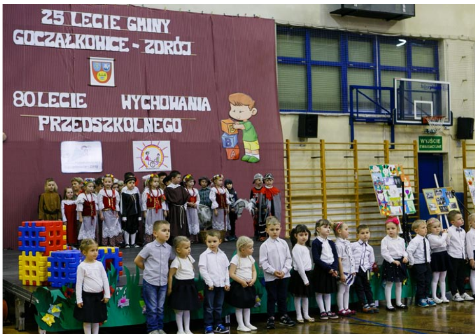
ZDJĘCIE NR 45 | OBCHODY 80-LECIA WYCHOWANIA PRZEDSZKOLNEGO