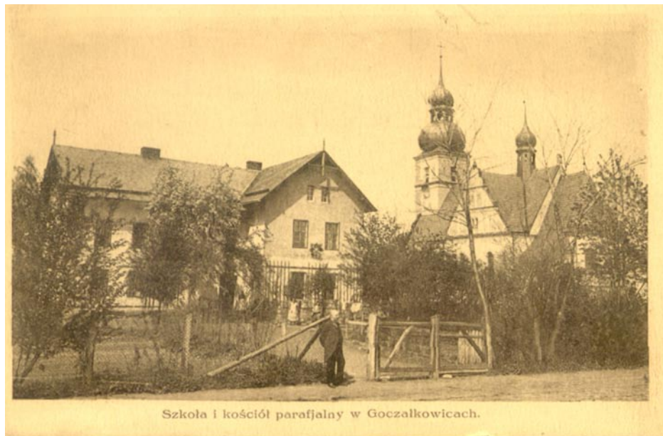
ZDJĘCIE NR 37 | BUDYNEK STAREJ SZKOŁY PRZY KOŚCIELE PARAFIALNYM