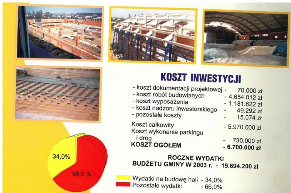
ZDJĘCIE NR 10 | BUDOWA HALI SPORTOWEJ