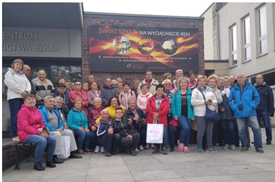
ZDJĘCIE NR 68 | KOŁO EMERYTÓW NA WYCIECZCE