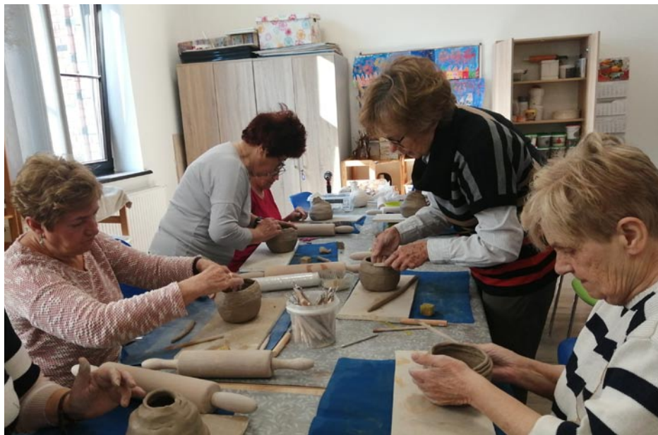
ZDJĘCIE NR 58 | ZAJĘCIA CERAMICZNE W KLUBIE SENIORA