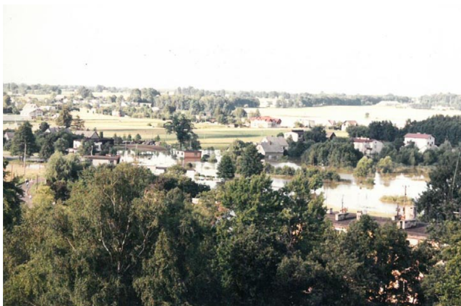
ZDJĘCIE NR 8 | POWÓDŹ 1997 ROKU. ZALANE BORKI – ZDJĘCIE WYKONANE Z BUDYNKU GWARKA