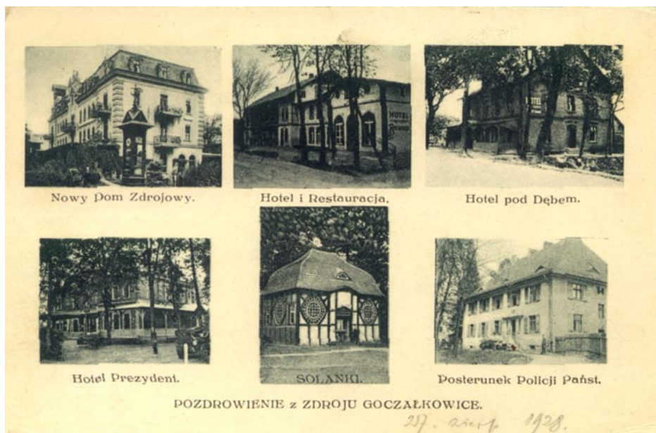
ZDJĘCIE NR 2 | UZDROWISKO W 1928 ROKU