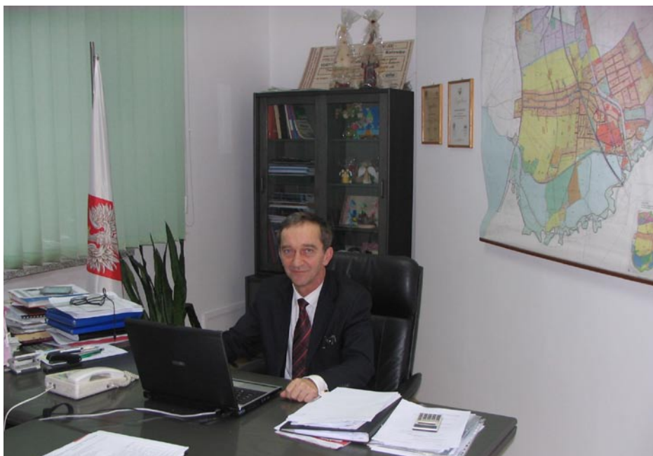
ZDJĘCIE NR 14 | KRZYSZTOF KANIK - WÓJT GMINY GOCZAŁKOWICE-ZDRÓJ