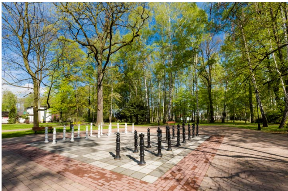
ZDJĘCIE NR 17 | PARK ZDROJOWY – 2016 ROK