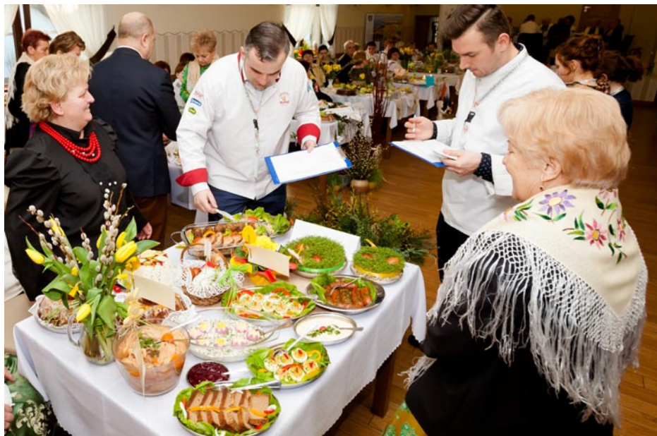
ZDJĘCIE NR 67 | KGW GOCZAŁKOWICE NA I POWIATOWY KONKURSIE KULINARNYM