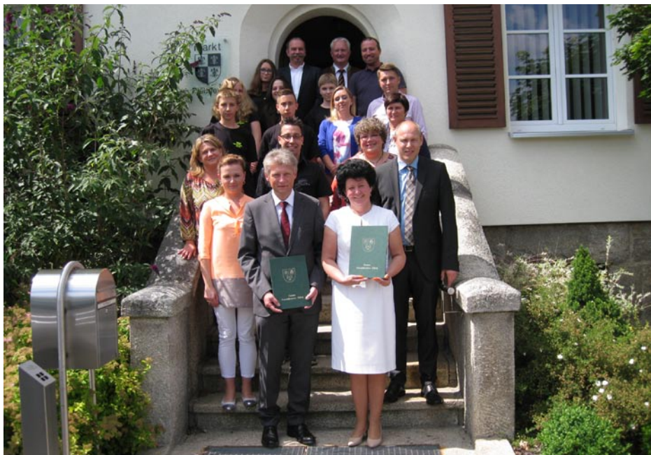
ZDJĘCIE NR 23 | PODPISANIE UMOWY PARTNERSKIEJ Z GMINĄ PLOSSBERG