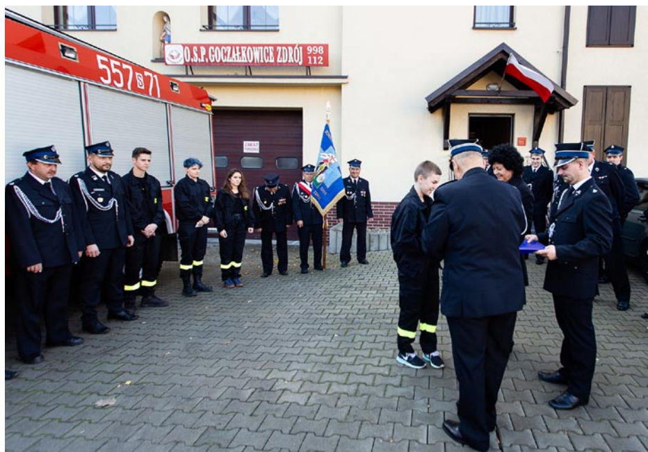
ZDJĘCIE NR 66 | WRĘCZANIE ODZNACZEŃ CZŁONKOM OSP GOCZAŁKOWICE